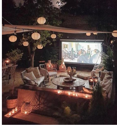
Кинотеатр на свежем воздухе