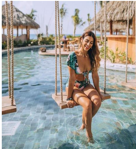
Качели над бассейном