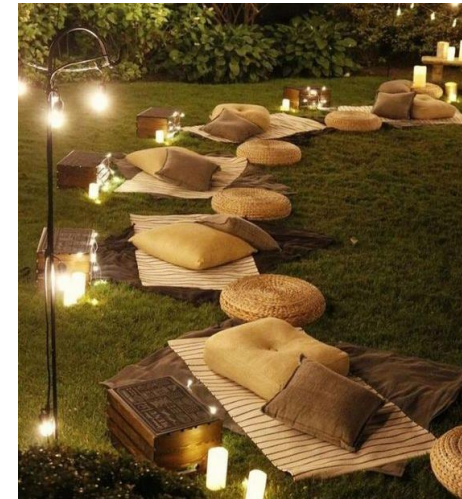
Тёплое мягкое освещение