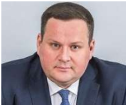
Котьяков Антон Олегович, Министр труда и социальной защиты Российской Федерации