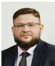
Зотов О.Ю., председатель Жилищного комитета Санкт-Петербурга